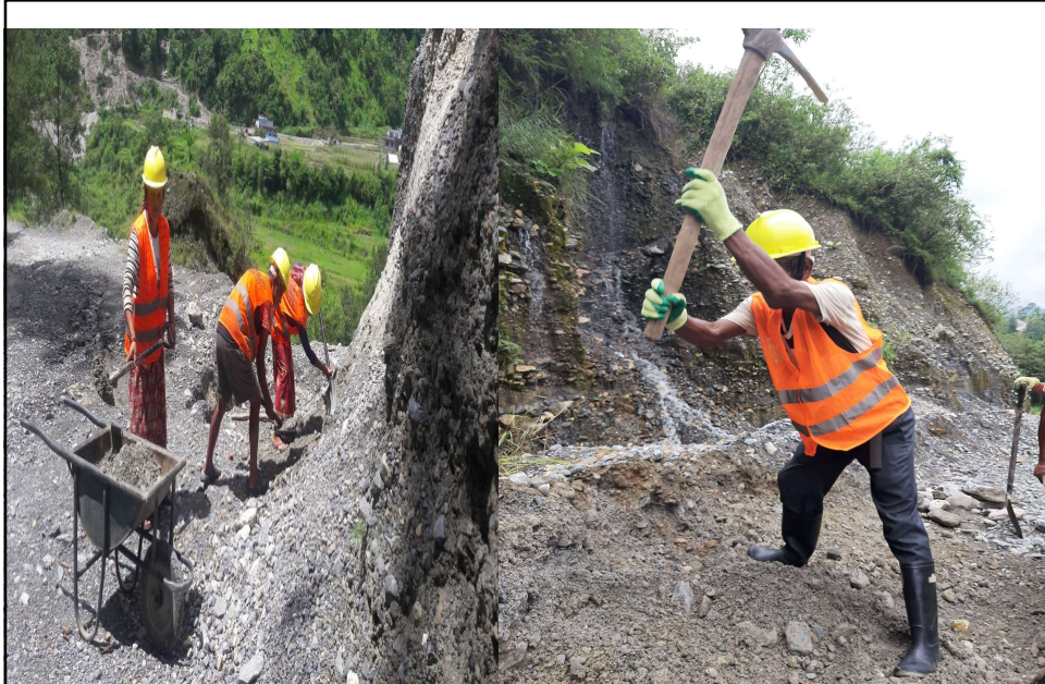
कामका लागि पारिश्रमिकमा आधारित कार्यक्रम