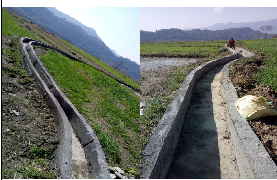
सिंचाई कुलो, वडा नं. ३