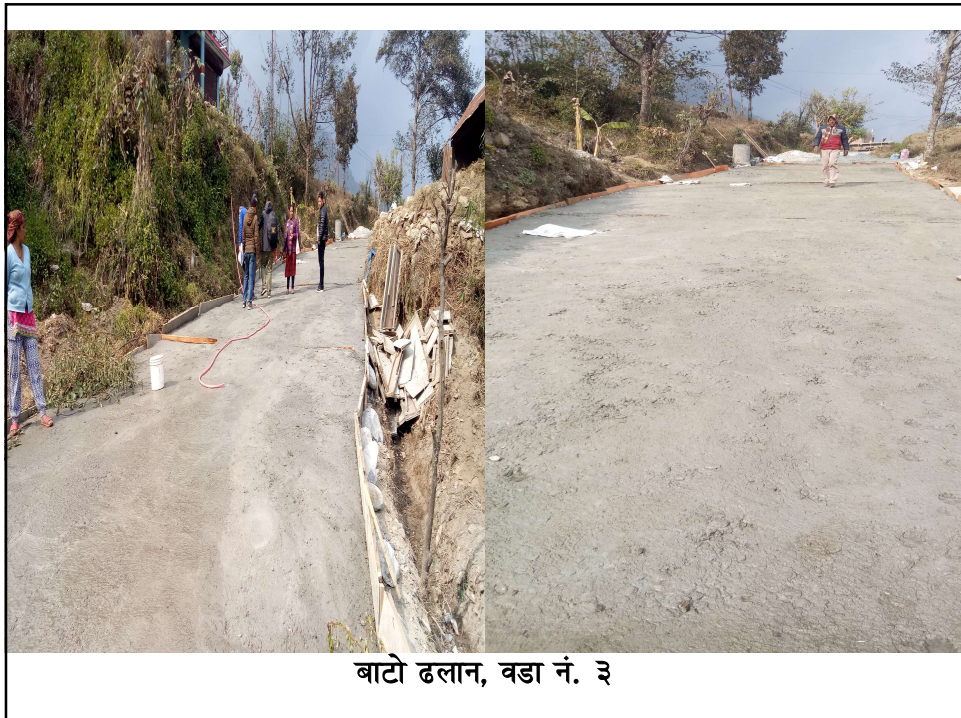
बाटो ढलान, वडा नं. ३