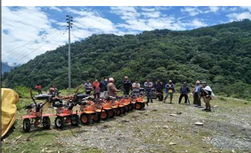
अनुदानमा हाते ट्याक्टर वितरण कार्यक्रम