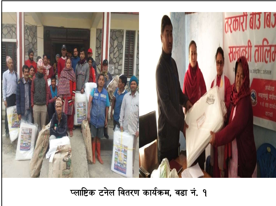
प्लाष्टिक टनेल वितरण कार्यक्रम, वडा नं. १